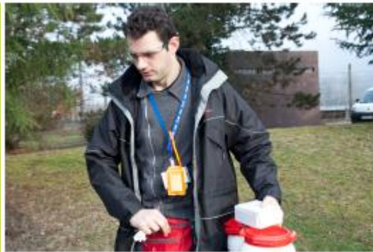
Un technicien préleveur vient relever les mesures du jour à la station météo et vérifier le bon fonctionnement des appareils.

Tous les jours, une tournée est effectuée par du personnel spécialisé du laboratoire de Creys-Malville pour assurer une surveillance continue de l'impact du site sur l'environnement.