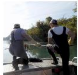
À table d'une corne et le crêpe, les techniciens pêchent le poisson de la centrale sur les bords du Rhône.