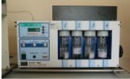
Les analyses de l'air