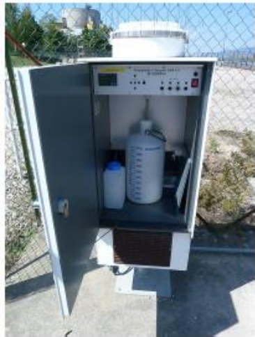
L'analyse de l'eau de pluie